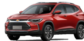
ROJO BURDEO METÁLICO