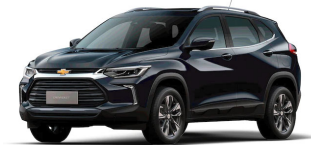
AZUL OSCURO METÁLICO