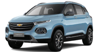
AZUL CIELO METÁLICO

*Equipamiento disponible según versión. GM Chile se reserva el derecho de hacer cambios o modificaciones en las especificaciones de sus modelos sin previo aviso.