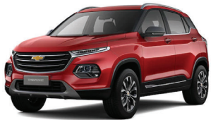
ROJO BURDEO METÁLICO