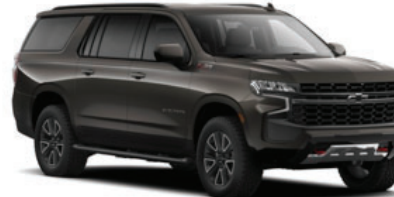
Gris Espresso Metálico