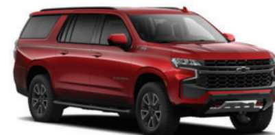
Rojo Burdeo Metálico