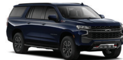
Azul Oscuro Metálico